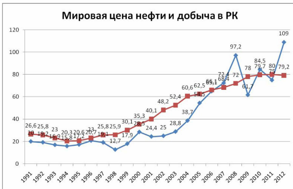
Рисунок 1 – Добыча нефти в РК и мировые цены

В сентябре 2013 года для мировой и казахстанской нефтяной отрасли произошло знаковое событие – консорциум North Caspian Operation Company (NOC) приступил к добыче нефти на гигантском месторождении «Кашаган», которое расположено в северной части Каспийского моря. Извлекаемые запасы нефти на месторождении составляют 4,8 миллиарда тонн нефти, а совокупные запасы углеводородов – 38 миллиардов баррелей. По данным Международного энергетического агентства, Казахстан по разведанным запасам нефти занимает 10-е место (39,8 млрд. баррелей), по уровню нефтедобычи – 17-е, по объему разведанных запасов газа и газового конденсата – 15-е место в мире (3 трлн. куб. м), по запасам энергетического угля (34 млрд. тонн) и объему добычи – 9-е место в мире [1].