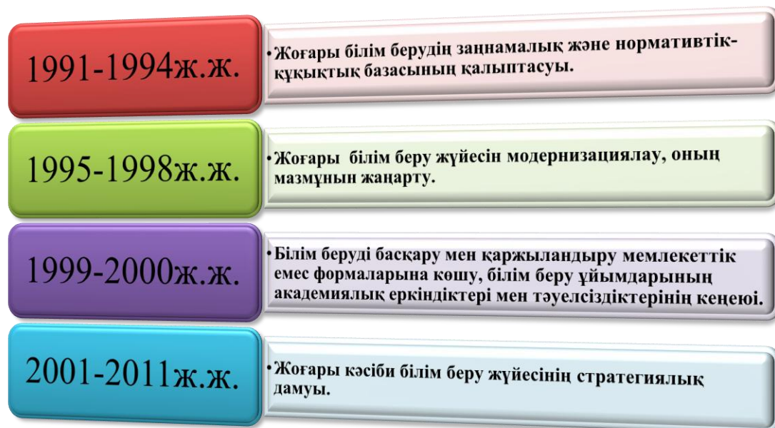
Сурет 1 - Қазақстан Республикасында жоғары білім беру жүйесін реформалаудың кезеңдері

Қазақстан тәуелсіздік алғаннан кейін жүргізілген жоғары білім беру жүйесін реформалаудың кезеңдерін келесі суреттен көруге болады.