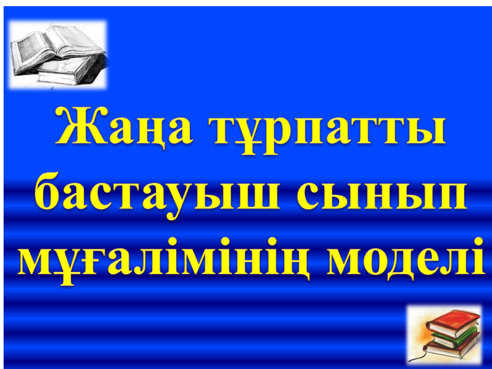
Сурет 3 - Жаңа тұрпатты бастауыш сынып мұғалімінің моделі

Бастауыш сынып мұғалімдерін кәсіби-педагогикалық даярлаудың тиімділігін арттырудың жолдарының бірі – студенттердің ғылыми-зерттеу жұмысы . Қазақстан Республикасы Ғылым туралы Заңында: студенттердің ғылыми-зерттеу жұмысы – бар білімді кеңейту және жаңа білім алу, ғылыми болжамдарды тексеру, табиғат пен қоғам дамуының заңдылықтарын анықтау, жобаларды ғылыми жинақтау, ғылыми негіздеу мақсатында ғылыми ізденіспен, зерттеулер, эксперименттер жүргізумен байланысты жұмыс, – деген анықтама берілген[157].