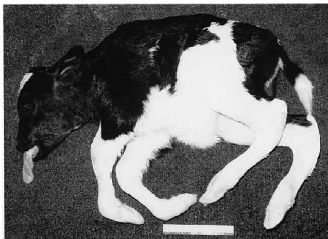
Рисунок 1 – Клиническое проявление синдрома – комплексное уродство позвоночника, CVM у телят

Полученные результаты свидетельствуют о роли носительства летальной рецессивной мутации в этиологии эмбриональной смертности у коров. Как видно на рисунке 1, характерными признаками CVM у телят являются уродство позвоночника, увеличение живота, выпадение языка, контрактура суставов, искривление грудного и шейного отделов позвоночника [4,5].