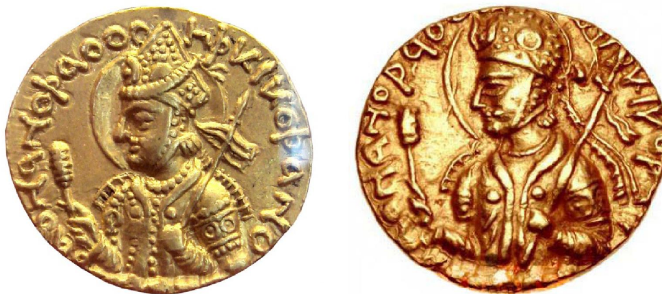
Золотые монеты Хувишки