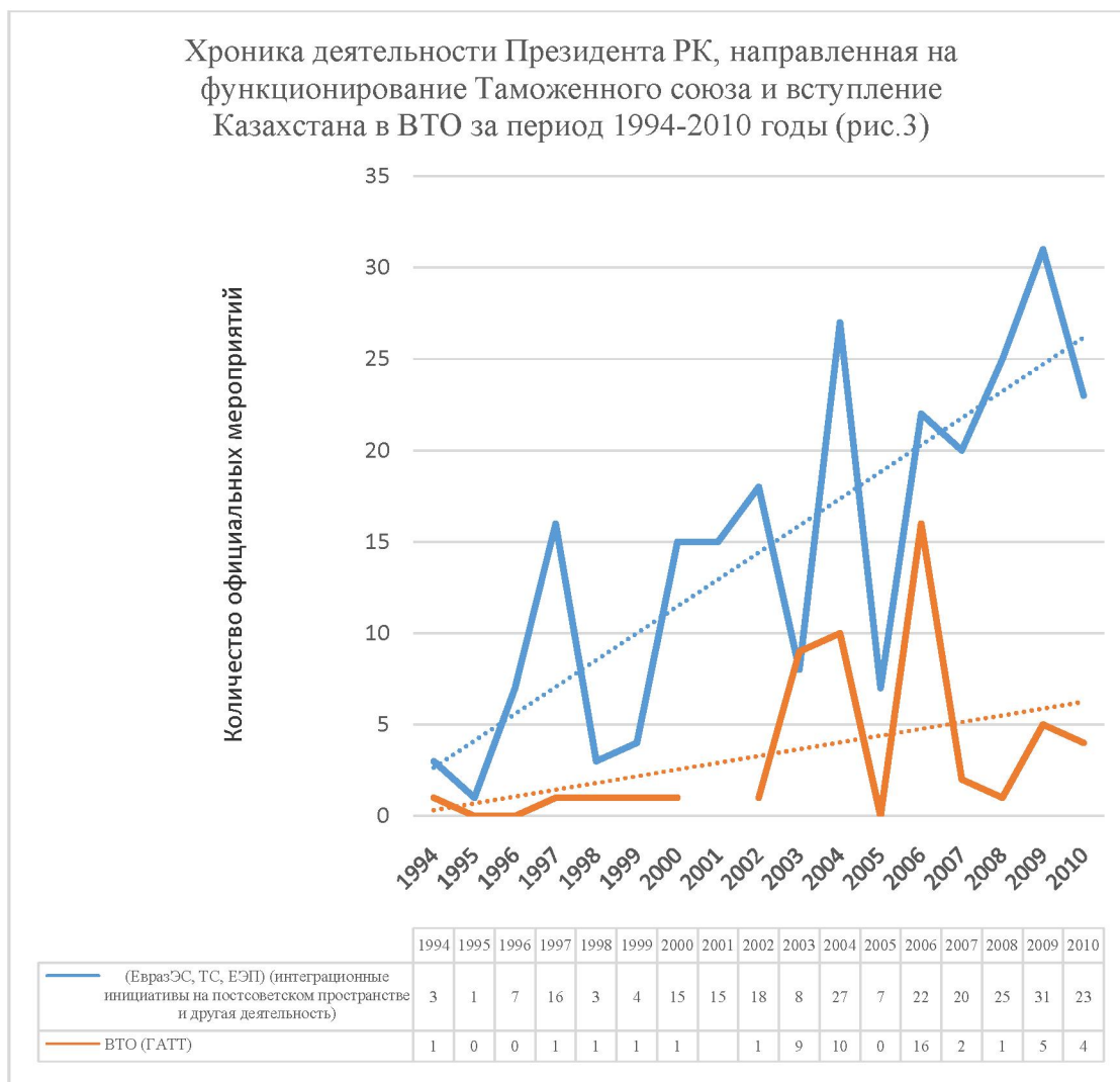
Хроника деятельности Президента РК, направленная на функционирование Таможенного союза и вступление Казахстана в ВТО за период 1994-2010 годы (рис.3)

Кривые графика иллюстрируют устойчивое намерение Казахстана сначала «укреплять Таможенный союз и Единое экономическое пространство» [17], посредством которых республика стремится «к скорейшему присоединению на скоординированных условиях к Всемирной торговой организации» [18, 19].