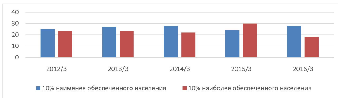
Рисунок 4 – Годовой прирост численности наименее и наиболее обеспеченного населения (тыс. чел) [7]

Сложившийся в стране нищенский уровень реальной заработной платы и критически высокая ее дифференциация породили многочисленные проблемы. Доля населения, имеющего доход меньше прожиточного минимума, составляет 25%.