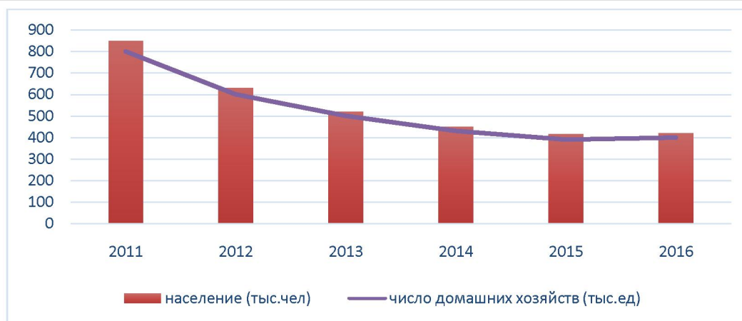
Рисунок 3 – Население имеющие доходы ниже прожиточного минимума [9]

Численность 10% наименее обеспеченного населения за год выросла быстрее, чем 10% наиболее обеспеченных. По сравнению с уровнем на конец 3 квартала 2015 года число малообеспеченных казахстанцев выросло почти на 27 тысяч человек, в то время как число обеспеченных граждан РК увеличилось на 18,3 тысяч человек.