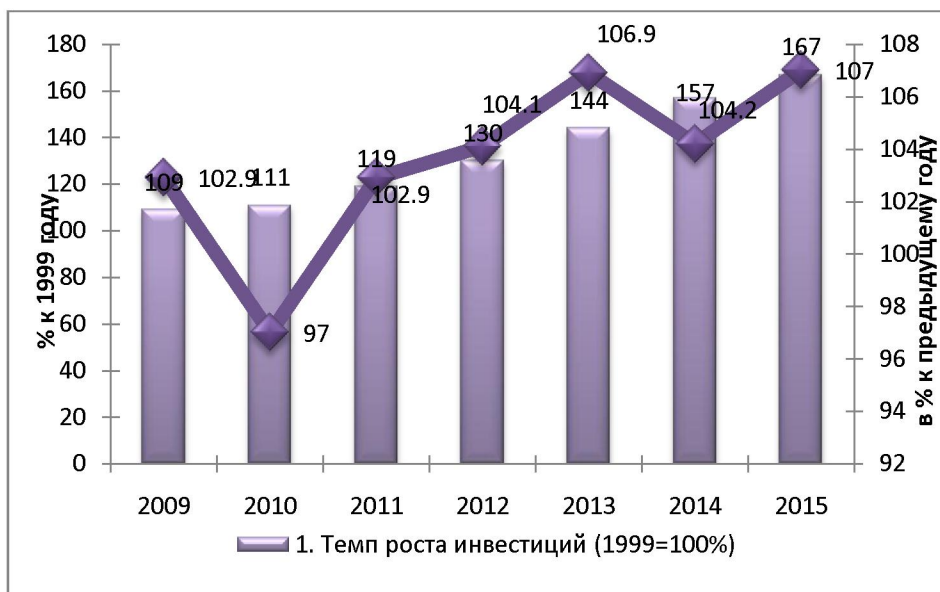
Рисунок 1 – Темпы роста инвестиций в основной капитал за 2009-2015 гг.

Источник: по данным Национального банка Республики Казахстан