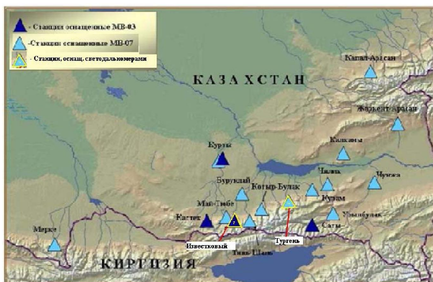
Рисунок 1 – Схема размещения пунктов скважин

Monitoring flow rates of thermal waters. The structure consists of 10 monitoring points (figure 1).