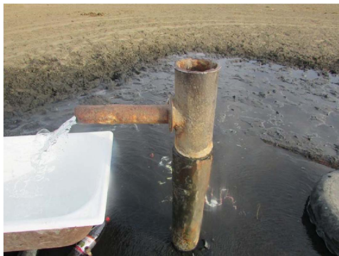
Рисунок 2 – Скважина № 162а колонкового бурения, заложенная у выхода родника

1 – diluvial-proluvial deposits; 2 – aeolian sands; 3 – silts; 4 – palaeozoic tuffs; 5 – granite; 6 – alleged fault line; 7 – hole; 8 – cutting line.