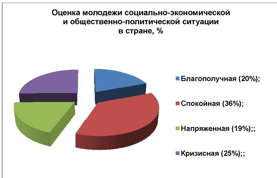
Диаграмма 1 – Оценка общественно-политической ситуации в Казахстане глазами студенческой молодежи

Один из блоков вопросов социологического исследования касался оценки общественно-политической ситуации, построения рейтингов доверия молодежи к основным политическим субъектам и институтам власти.