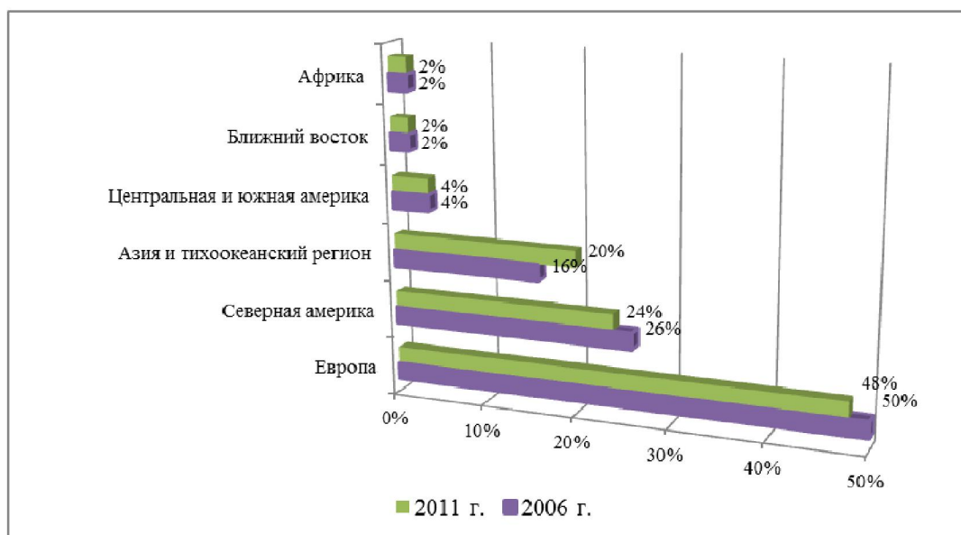
Рисунок 1 – Региональные тенденции долевой структуры выставочного рынка в 2006-2011 гг.

Как видно из таблицы 1, в 2011 году почти половина крупных выставочных центров мира расположена в Европе. Уже на протяжении нескольких лет Европа остается центром выставочной индустрии, именно здесь ежегодно проводится самое большое количество выставок (рис. 1).