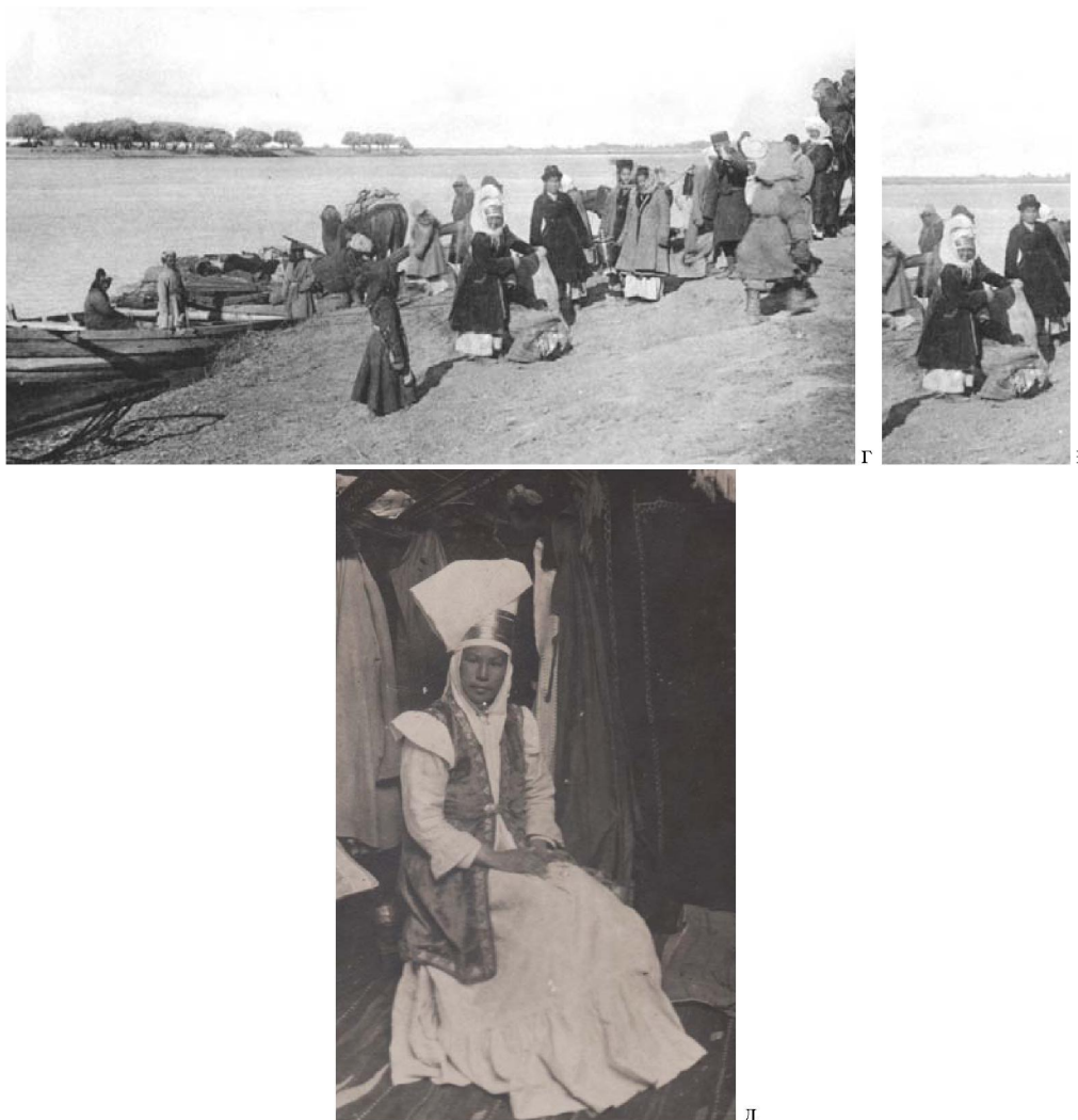
Сурет 4 - а-д) Зер таспалы кимешекті әйелдер, а-б - [10-11]; д - ҚРММ қоры (ФКП22)

Кимешектің тағы бір түрін ұзындығы енінен екі есе ұзын матаның ұзын жағына екі шетінен бүктеп екі жағынан тігетін болған. Екі қабат матадан тұратын шаршының бір жағы кимешектің алдыңғы бөлігі, екінші ұшы артқы жағына түскен. Оның тігілмеген төменгі бөлігін кесіп, жарты шеңберлік түрге келтірген, ал жоғарғы бөлігінен бетке орын ашқан. Төбеге келетін бұрышты аздап кесіп соған қайтадан тігіп бекіткен құраған. Кимешек төбесінен, жоғарғы бөлігінен «күндік» қызметін атқаратын жаулық оралған. Күндік бөлігінің қызметі басты қыста суықтан қорғау, жазда ыстықты өткізбеу болып саналады. Бұл қыста суық, жазды аптап ыстықтан қорғаған. Кимешектің сыртынан тартатын жаулық шылауыш , шаршы деп аталған.