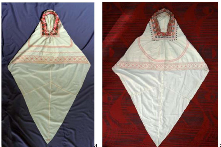
Сурет 7 - а) Кимешек. ҚР MOM қорынан (КП 14220); ә) Кимешек. ҚР MOM қорынан (25448/54)

ҚРМOM қорындағы (КП 14220) К.-нің өңірі мен басты жауып тұратын бөлігі екі қабатталып тұтас пішілген, төбесі бөлек пішіліп, қондырылған. К.-тің артқы бөлігі төрт бөлек етіп пішіліп, жалаң қабат матадан тігілген. Бет ойығы трапеция пішінді, жиегіне қызыл зермен көгеріс өрнегі түсірілген, алқым тұсына бүрме салынған. Маңдай, шықшыт бөлігіне ұсақ шытыралар қондырған. Өңіржиегі қосарланған кереге тігіс пен сағатбау түрінде сырыла жиектелген. Барлық тігістер қызыл жіппен түсірілген [4; 6, 93-98 бб.]