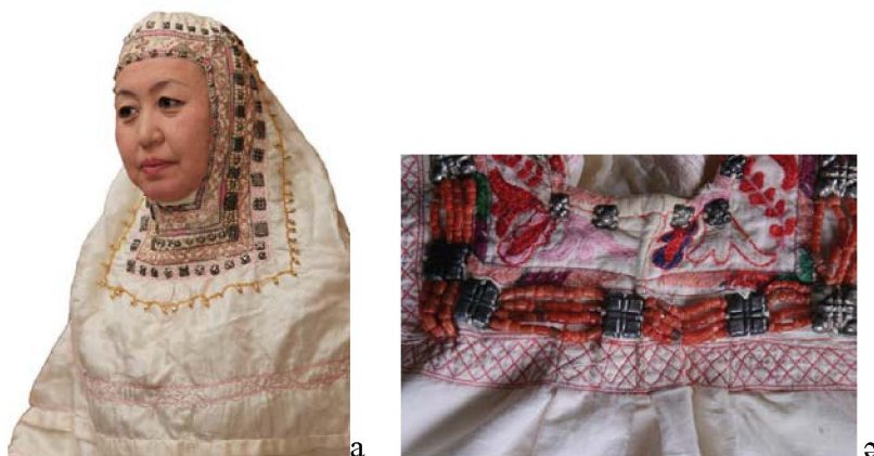
Сурет 5 - а) Жетісу өңірі кимешегі. ОМЭЭ материалдарынан; ә) Жетісу өңірі кимешегінен фрагмент. ҚРМОНМ қорынан (25448/54)

Кимешекті қолданатын қырғыз халқында күндігі үлкен, биік келеді, ал түрікмен халқы басқа оралған ішкі жаулықтың сыртынан үлкен жаулықты бос тастайды [13, с.101].