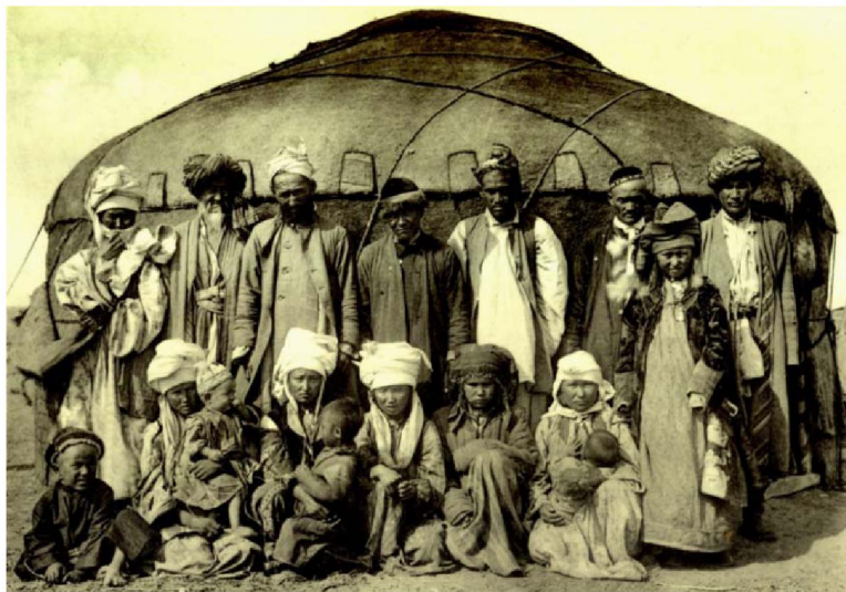
Сурет 1 - Орама кимешек киген келіншектер. Қызылқұм қазақтары.

Кимешектің аймақтық ерекшеліктері. Қазақ әйелдерінің кимешек киюі және оның сыртынан шылауыш тартуы әр өңірде әртүрлі.