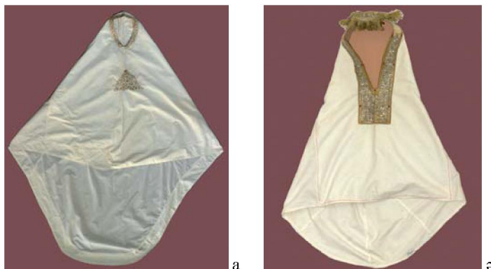
Сурет 6 - а) Кимешек. ҚР MOM қорынан (КПД 271); ә) Кимешек. ҚР MOM қорынан (КП 18083)

Кимешектің музейлік сипаттамасы. ҚР MOM қорындағы (КПД 271) кимешектің алдыңғы жағы үш, артқы жағы бес бөліктен тұратын мақта матадан тігілген. Бас, иық, желке тұстарына астар салынған, ал құйрық бөлігі доғалданып және бір қабат матадан тігілген. Төбе бөлігі бөлек пішіліп, бүрмеленіп салынған. Кимешектің бет ойығы зооморфтық өрнектер негізінде зер жіппен жиектелген. Өңіріне де үшбұрыш пішінінде зооморфтық өрнек зер жіппен кестеленген. Етегі айнала бүгіліп, сырылып тігілген.