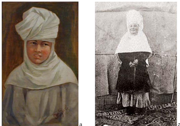
Сурет 2 - а) Орама кимешек. Н. Г. Хлудов. ҚР МОМ қорынан КП (3655); ә) Орама кимешек. ҚРМОМ. ФКП

Орама кимешек Солтүстік Қазақстанда, Ақмоланың батысында және Оңтүстік пен Сыр бойында кең таралған.