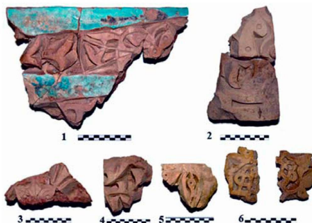
Рисунок 3 – Облицовочный кирпич с растительным орнаментом