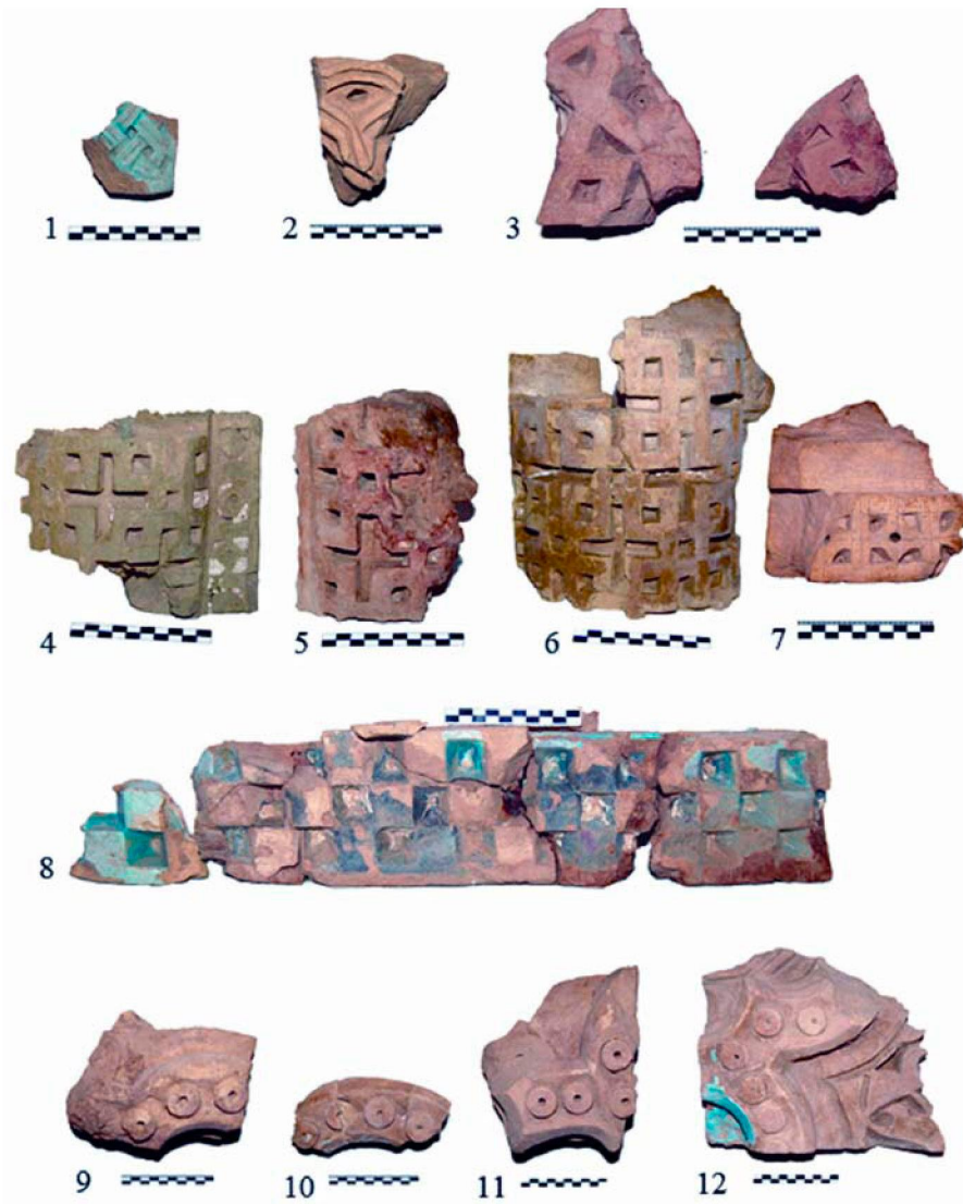
Рисунок 5 – Облицовочный кирпич с геометрическим орнаментом