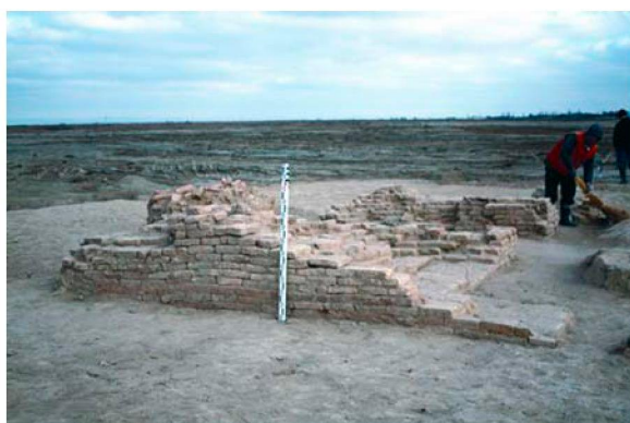
Рисунок 2 – Раскопки мавзолея