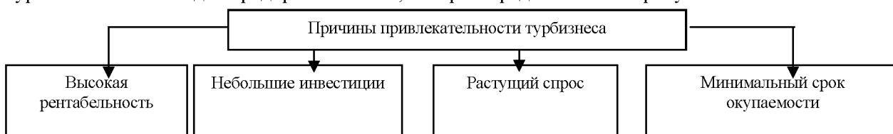
Рисунок 3 – Основные причины привлекательности туристского бизнеса для предпринимателей

В ходе исследования нами были выделены 4 основные причины привлекательности туристского бизнеса для предпринимателей, которые представлены на рисунке 3.