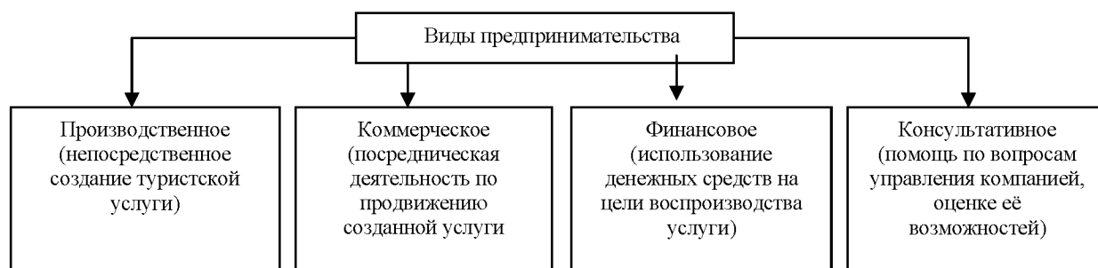
Рисунок 1 – Виды предпринимательства

В связи с особенностями туристских услуг предпринимательская деятельность туристских организаций может быть лишь условно отнесена к определенному виду. Так, деятельность туроператоров в большинстве случаев создает организационную подготовку турпродукта и его частичное производство, и продвижение к потребителю. Поэтому деятельность туроператоров можно условно отнести к производственному предпринимательству.