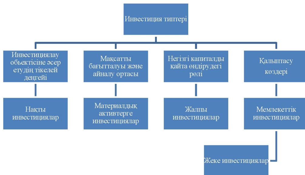
1-сурет – Негізгі белгілері бойынша инвестициялардың сыныптамасы

Инвестициялардың барлық типтерін топтауға болады және келесідей сыныптамада көрсетуге болады (1-сурет).