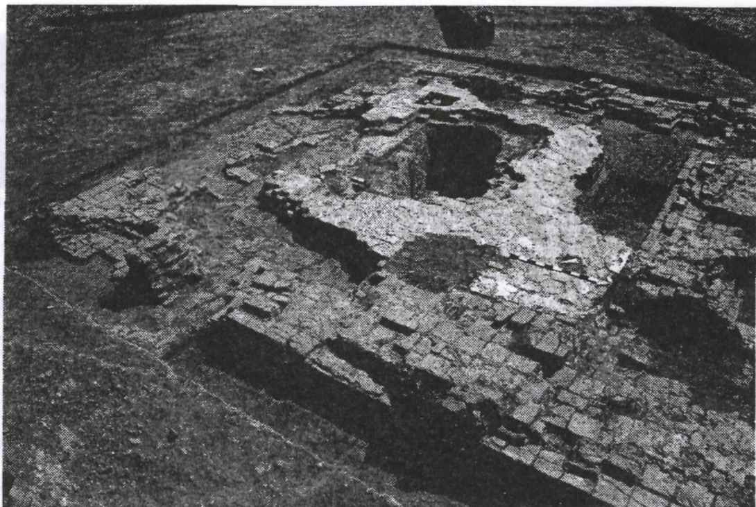
13. Городище Жайык. Остатки мавзолея. XIV в.

Во время исследований, проведенных в начале XXI в. вблизи Уральска, было обнаружено два средневековых городища по обоим берегам р. Урал, которые располагались почти напротив друг друга.