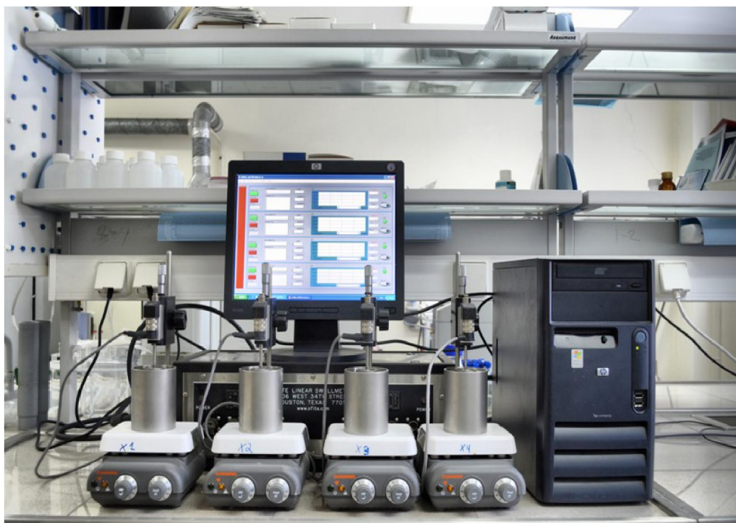
Рисунок 1 – Тестер продольного набухания в динамическом режиме

При таком подборе ингибиторов можно отметить, что хлориды калия и аммония участвуют в обменных реакциях и гидрофобизуют поверхность глин, ГКЖ гидрофобизуют поверхность.