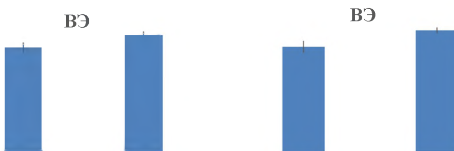
Рисунок 1 – Средние значения шкалы «Внимание к эмоциям» (ВЭ) по методике эмоционального интеллекта в разрезе гендера и возраста

Были выявлены значимые различия в показателе ВЭ по гендерному ( F=4,60 ; p=0,04 ) и возрастному ( F=6,09 ; p=0,02 ) признакам (см. рисунок 1).