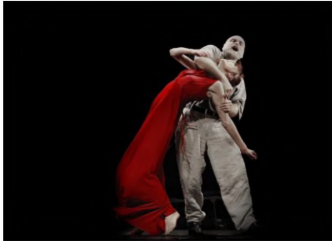
Рисунок 1 – «Отелло» (2010). Реж. Э. Някрошус, театр «Meno fortas»

Характерным для героев Э. Някрошуса выступает склонность предаваться открытой игре на сцене, которая является средством противостояния жизни, непринятию ее законов. Показательна сцена, в которой актеры перепрыгивают через валуны, словно дети, играющие в чехарду или в сцене с песком, где они пластически изображают ребят, возящихся в песочнице. Символическим эпизодом прощания Дездемоны и Отелло, в котором движения с перемещением стульев представляет собой не то танец расставания, не то игру с перебежками. Двигаясь от одного стула к другому, Дездемона пытается быть то тут, то там – она мечется словно мотылек над лампой.