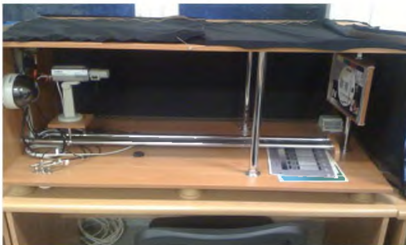
Figure 2 - Appearance of the laboratory table №1

For the experiment, an IP video camera "NOVUS NVIP-TC2400D / MPX1. 3-II" was used, which was installed on a laboratory stand designed for the study and research of analogue CCTV systems, on the left end wall of the laboratory table № 1 (figure 2) [2].