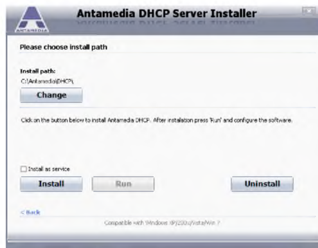
Figure 4 - Antamedia DHCP Server Installer window

Running the dhcp-installer program and agreeing to its terms, we get the distribution of IP addresses, which is shown in figure 4.