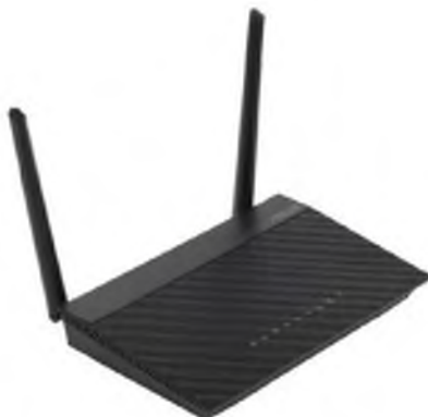
Figure 5 -ASUS RT-AC52U B1 router

Today, there are modern and high-speed Wi-Fi router which supports wireless standards 802.11 a/b/g/n/ac, and can operate in 2 frequency bands such as 2.4 GHz and 5 GHz. Therefore, there is a possibility of traffic with high speed is 733 Mbit/s, which will significantly affect the figure as processing time and packet delay, in addition to Wi-Fi interface it enables connection of copper source and optical fiber [5].