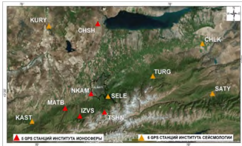
Figure 1 - Location of local GPS stations in the Northern Tien Shan

Since 1993, many years of research on the study of modern movements in the Northern Tien Shan were carried out as part of the International Project with the participation of specialists from the Massachusetts Institute of Technology, specialists from Kyrgyzstan and Kazakhstan [7]. In addition, starting in 2009, the Ionosphere Institute and the Institute of Seismology implemented the work on the deployment of a regional network consisting of 11 GPS stations (figure 1). These stations are used for continuous observations in the foothills of the Ile Alatau in the zone of a possible earthquake with a magnitude of 9 points, which makes it possible to evaluate seismic activity in the on-line mode.