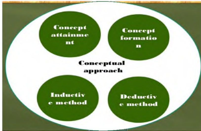
Figure 1 – Conceptual approach

The functioning of the system as a whole involves the development and implementation of the processor of the control system. The management system process, taking into account the preference for using the conceptual method, includes the formation procedure and the procedure for solving managerial problems. These procedures are part of the rationale for management decisions.