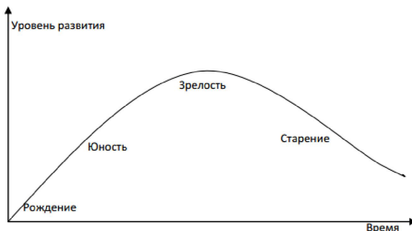
Рисунок 2 – Модель жизненного цикла организации С. Е. Кована и А. Н. Ряховской

Такие исследователи, как С. Е. Кован и А. Н. Ряховская [1] на основе анализа существующих моделей жизненного цикла компаний выделяют 4 основные стадии развития организации: рождение, юность, зрелость и старение. В связи с тем что, по нашему мнению, данная модель содержит наиболее важные этапы, характерные для жизненного цикла любой организации, в целях анализа причин возникновения банкротства воспользуемся моделью указанных авторов.