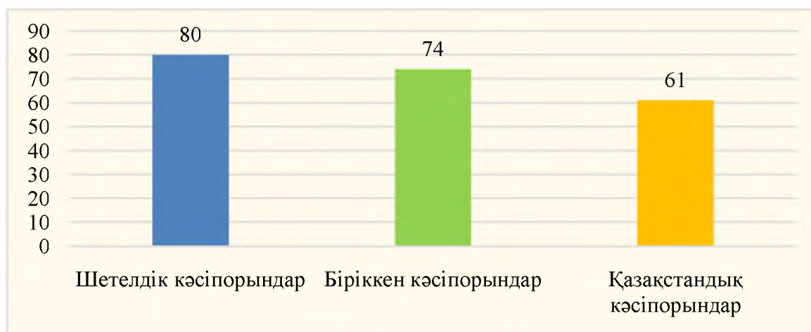
2-сурет - Бизнестің әлеуметтік жауапкершілігі жөнінде білетін меншік формалары бойынша кәсіпорындар саны

Шетелдік компаниялармен салыстыру барысында келесі мәліметтер алынды (2-сурет).