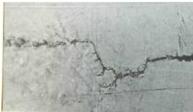
Figure 3 – Formation of a new fatigue crack one of the branches

In this case, after removal of the load can be seen the residual crack opening. Cyclic loading after an overload leads to the formation of a new crack one of the branches of the crack (figure 3).