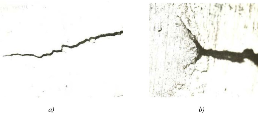
Figure 2 – The top of the fatigue crack: a) before the overload; b) after overload

Results and discussion. Overload leads to a significant disclosure to the crack tip blunting and vetvlienyu Usti cracks in the vicinity of which is highly developed plastic zone (figure 2).