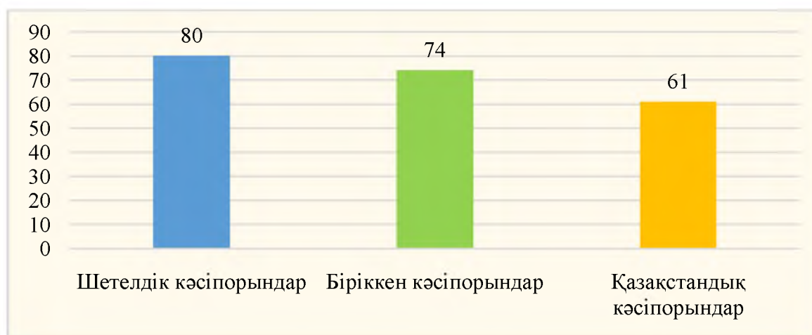
2-сурет – Бизнестің әлеуметтік жауапкершілігі жөнінде білетін меншік формалары бойынша кәсіпорындар саны

Шетелдік компаниялармен салыстыру барысында келесі мәліметтер алынды (2-сурет).