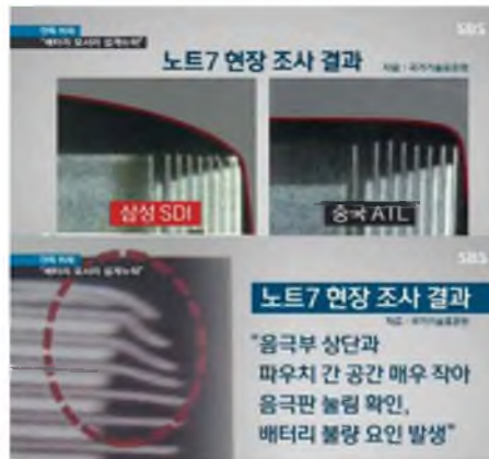
Рисунок 4 – Дефект в корпусе смартфона Galaxy Note 7 [11]

Данные диаграммы показывают, что послужило основными причинами возгорания смартфона. Согласно этим данным, основная причина некачественный материал, спешка производителя, слабый контроль качества. А всему этому послужило виной то, что компания спешила выпустить свой смартфон раньше Apple, таким образом, весь процесс сопровождался спешкой. Многие факторы и отклонения не были учтены, что и привело к плачевным результатам. В следующем рисунке виден явный дефект в конструкции смартфона, который не был взят во внимание специалистами.