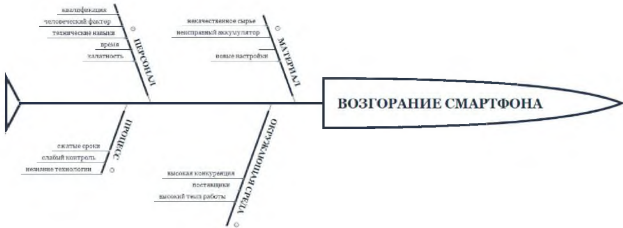
Рисунок 3 – Диаграмма Исикавы для компании “Samsung”

Компания прекратила производство и продажи Galaxy Note 7, фаблет исчез с сайта компании, но вопросов к устройству всё ещё много. Главный из них – в чём же заключалась причина взрывов? На родине Samsung, в Южной Корее, тщательно исследовали качество фаблета и обнаружили, что у есть несколько критических недостатков. Чтобы показать их построим еще одну диаграмму Исикавы.