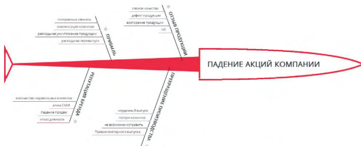
Рисунок 2 – Диаграмма Исикавы для компании “Samsung”

В качестве данных для построения диаграммы Исикавы был взят неблагоприятный опыт компании “Samsung”, связанный с отзывом продукции, который привел к ряду проблем, в частности, к падению акций компании. С помощью причинно-следственной диаграммы попытаемся выявить причины, которые привели к нежелательным последствиям.