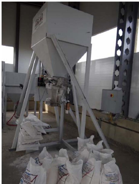
Рисунок 2 – Шнековая смесительная установка «Т-1»

Жидкость полиметилсилоксановая в состоянии аэрозоля была введена в состав гранулированной аммиачной селитры марки «Б» по ГОСТ 2-2013 производства АО «СДС Азот», РФ при ее шнековом перемешивании на установке типа «Т-1» в концентрации 10 мл/тону.