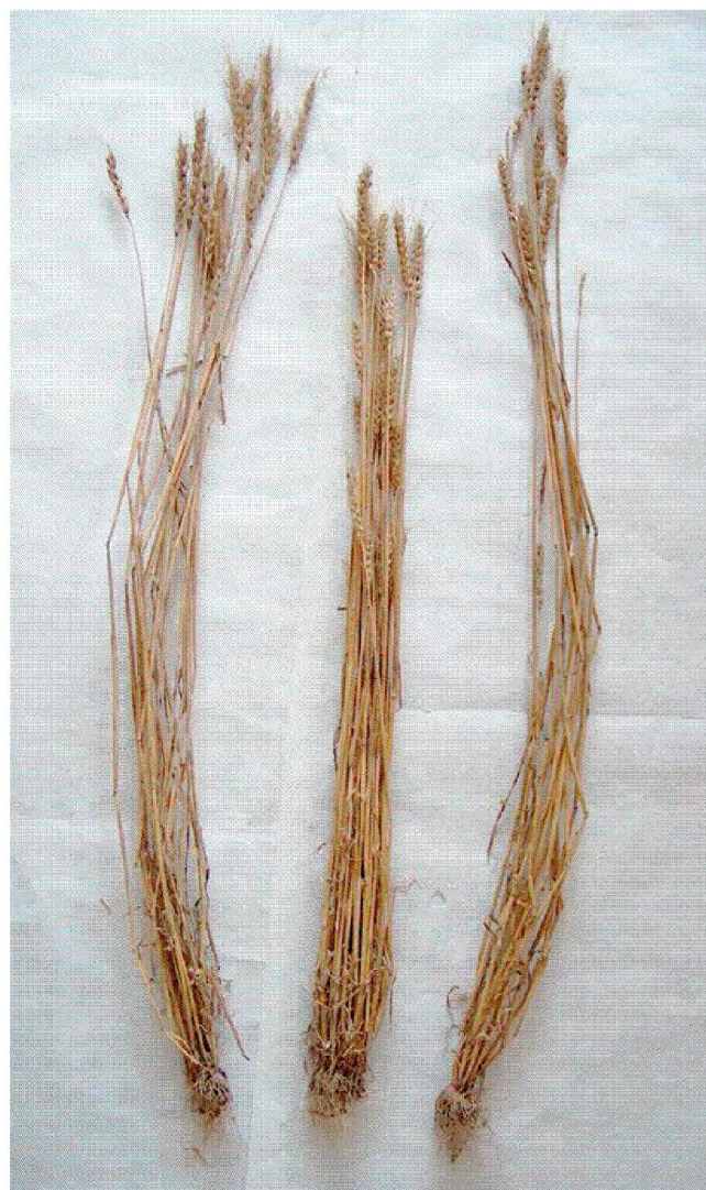
Рис.1. Влияние ПАВ на продуктивную кустистость, коленачатым типом стебля сорта пшеницы Казахстанская 3: 1 – измененное растение; 2 – контроль; 3 – измененное растение

Морфометрическое изменение растений под действием химических соединений. Изучение действия химических соединений на районированные сорта яровой мягкой пшеницы (Шагала, Толкын, Дауыл, Казахстанская 3, Казахстанская 4, Казахстанская 17, Женис, Лютесценс 32) показало, что они индуцируют у пшеницы фенотипические изменения, выражающиеся в стимуляции прорастания, ускорении роста первичных корней и последующего увеличения продуктивной кустистости у растений. Сорта Казахстанская 3, Шагала имели более высокую и толстую соломинку, разросшиеся удлиненные