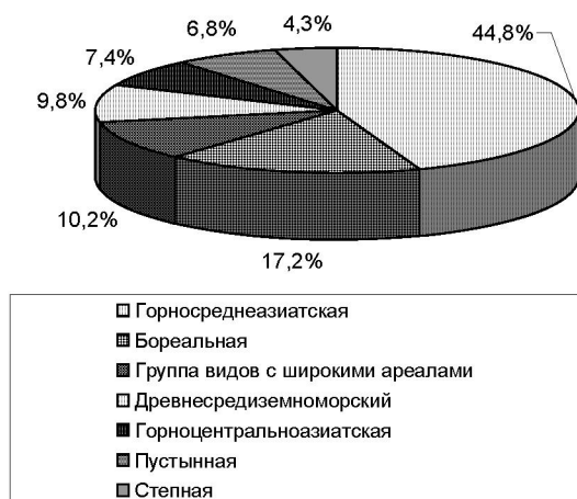
Рис. 1. Соотношение ареологических групп во флоре хребта Кетмень-Темерлик

В этой группе связующая горносреднеазиатско-сибирская подгруппа представлена – 104 видами, из них собственно горносреднеазиатско-сибирских – 37, тьяншано-алтае-сибирских – 44, северотьяншано-алтае-сибирских – 8.