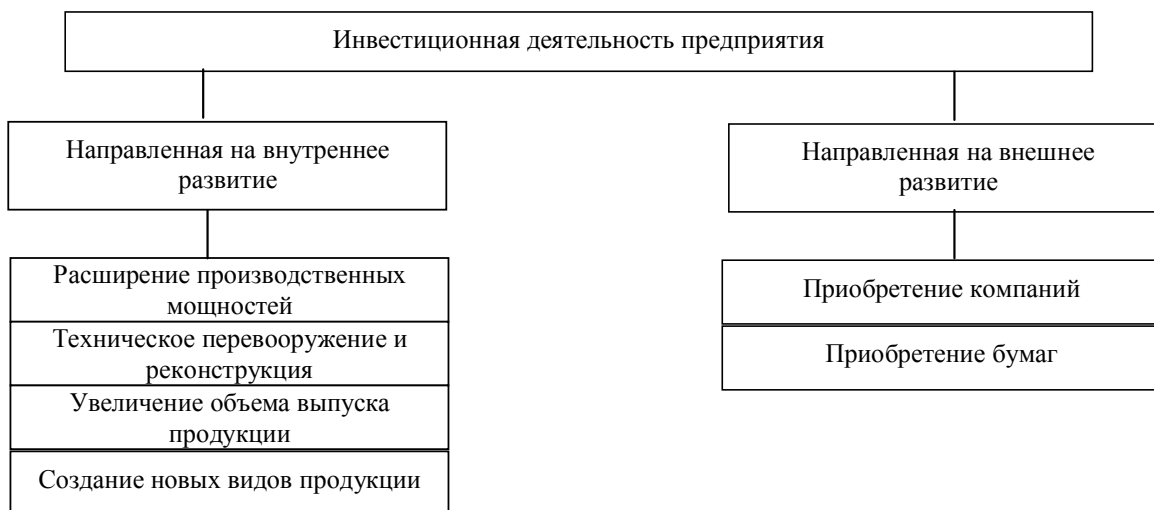
Рис. 2. Направленность инвестиционной деятельности предприятия в рыночных условиях по данным работы [3, с. 55]

По своей направленности инвестиционную деятельность предприятий можно разделить на два основных типа: внутреннюю и внешнюю (рис. 2).