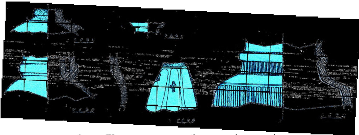
3-сурет. Шыңылтырлы көркем күмбез ұшының фрагменттері

ған күмбез ұшының (3-сурет, 1-3) бұл бөлігі ортағасырларда қолданылған қабырғалы күмбездердің формасын бейнелейді. Күмбез ұшын бояуда жасыл, көк түсті бояулар қолданылған. Кезінде кесененің күмбезі аспан көк түсті бояуы күн сәулесінің түсуімен ақшыл, сары түске ұласып, көз тартарлық сипатқа ие болып, әсем көрініс берген. Күмбез ұшының бояуының мың құбылып, түрленуі ортағасырлық сәулеттік керамиканы әрлеуде қолданылған шыңылтырлардың сапасы мен түріне байланысты болған. XII ғ. қалайы шыңылтырдың кең тарауымен қатар пайда болған, шеберлер люстр деп атаған бояуды қолданылғаны анық. Бұл алтын мен металдың кере-мет жарқылғының піл сүйегі түсті қалайы шыңылтырдың түсімен үйлесіп, жеңіл кемпіркосақтың түсіндей, күн сәулесімен керемет үйлескен асқан бір салтанат береді 12 .