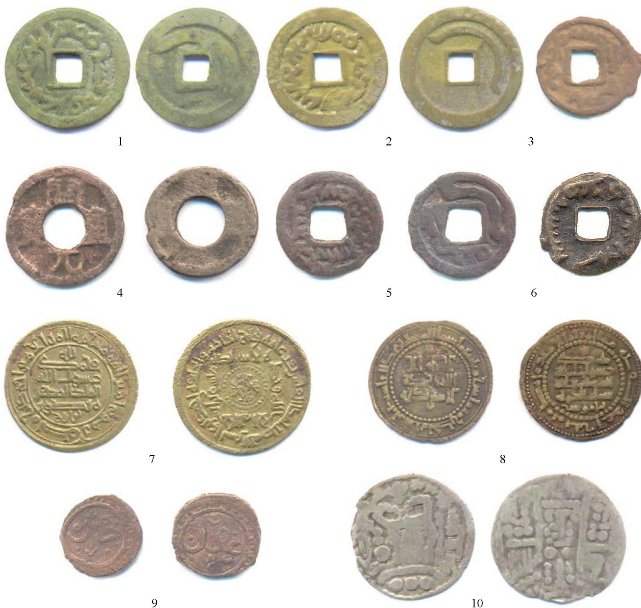
Рис. 3. 1-2 – Тюркешский каганат. Господин тюркешский каган , разновидности по рисунку тамги, первая половина VIII в.; 3 – тюркешский каганат, тухусский государь , вторая половина VIII – нач. IX вв.; 4 – местные подражания монетам кайюань тунбао , конец – VIII–IX вв.; 5-6 – Тюркешский каганат с дополнительной тамгой на реверсе и отличием в написании легенды, середина VIII в.; 7-8 – Саманиды, Мансур б Нух, Фергана, б/г и Караханиды, Шихаб ад-даула Аба Муса Бугра хан Харун б. Сулейман и Мухаммад б. Али, Тараз, 381 г.х.; 9 – Джател; 10 – «черный дирхем» бухархудатского типа

Впервые на городище Шельджи и вообще в Таласской долине найдены 4 монеты тухусов, причем двух размеров, крупные (рис. 3, 3) и средние (в очень плохом состоянии). Ранее находки этих монет в основном концентрировались на Краснореченском городище, и потому принято считать, что монеты тухусов, своеобразный городской выпуск Навеката с небольшим ареалом распространения, в отличие от тюркешских