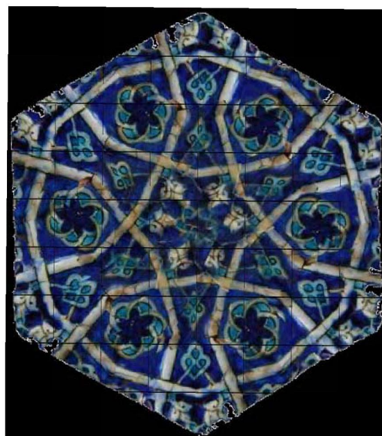
Рис. 3. Реконструкция майоликовой плитки с панно фасада

Орнамент на плитке представлен в виде растительных узоров сочетающихся с переплетающимися полосами, которые разделяют все внутреннее пространство данной композиции на разные геометрические фигуры и относительно небольших размеров розеток, выстроенных путем наложения друг на друга, повернутых по разным осям двух переплетающихся узоров, состоящих из трех соединенных полуокружностей. Центром данной орнаментальной композиции является своеобразный шестилепестковый узор, который создает дугообразно изогнутые, переплетающиеся между собой тонкие стебельки, вырастающие из центральных лепестков лилий, чьи бутоны примыкают к каждому внутреннему углу шестиугольной звезды, образованной переплетениями ломаных полос. В свою очередь, бутоны лилий так же соединены тонкими стебельками с так называемыми «четырёхлистниками», которые и завершают центральную шестилучевую композицию (рис. 3).