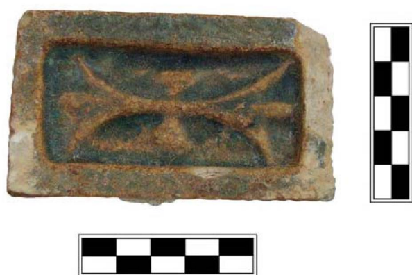
Рис. 2. Изразцовая плитка из арки

обрамляет бортик шириной 0,8 см, высотой 0,3–0,5 см. Центрально-вертикальная ось данной крестообразной композиции представлена двумя фрагментами орнамента «подтреугольной» формы, зеркально отраженных друг от друга относительно горизонтальной оси, которой условно является короткий стебель, соединяющий между собой два, симметрично расположенных друг напротив друга трилистника (рис. 2).