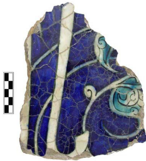
Рис. 4. Фрагмент майоликовой кашинной плитки, с изображением растительного и эпиграфического видов орнамента

Исследуя аналогии более раннего времени XI–XII вв., можно проследить развитие декоративно изобразительного искусства в области оформления мемориальных сооружений и преемственности традиционных архитектурных форм в планировке и создании объемов. Так, можно отметить, что развитие декорирования, началось с использования различных типов кладок в фасадах для более живого и экспрессионистского восприятия объекта, далее перешло в применение более выразительных элементов убранства, таких как терракота и майолика и завершило свой путь в использовании комбинированных способов орнаментации.