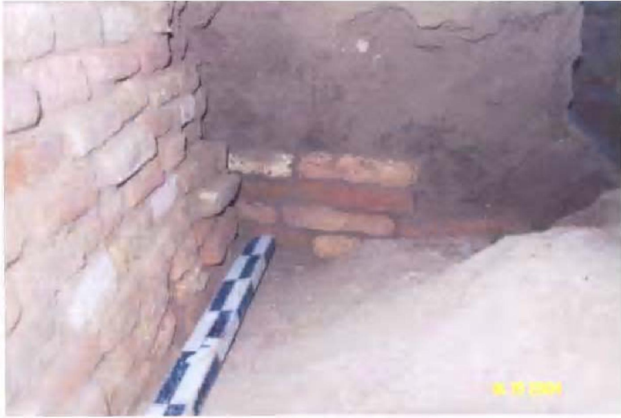
Рис. 3. Остатки сооружения XIV века