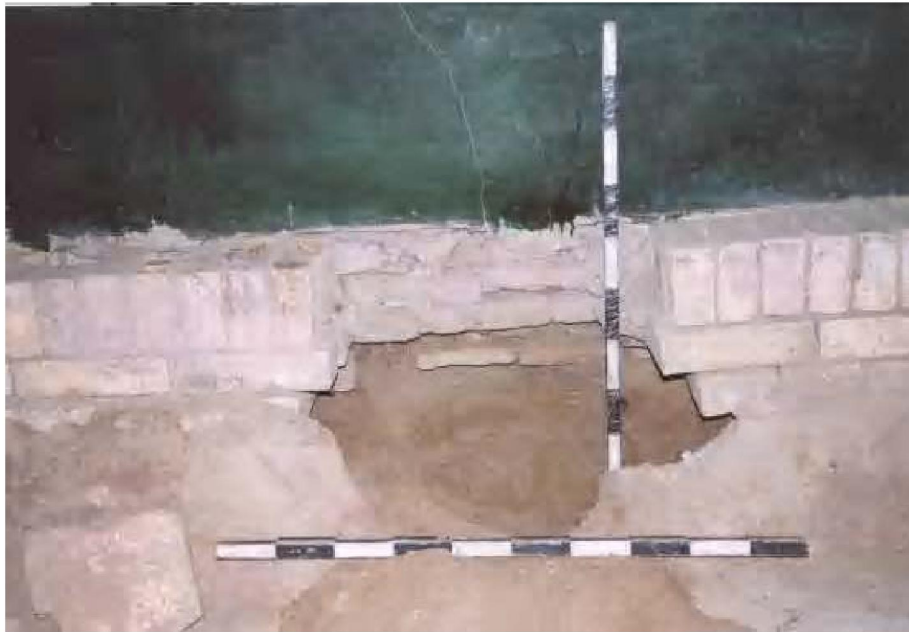
Рис. 4. Остатки сооружения XIV века

Кладка уходит вовнутрь на 12 см от фаса современного надгробия. Стену исследуемого сооружения обнаружить не удалось, и ее ширина осталось не выясненной, так как дальнейшее исследование надмогильного сооружения стало невозможным без сноса современного надгробия перекрывающего сооружение.