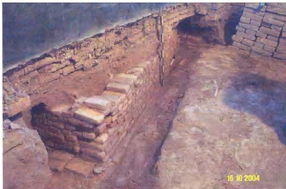
Рис. 2. Сооружение XII века

выявлена часть сооружения (северная стена и часть восточной стены) (рис. 2). Сооружение сложено из жженных кирпичей прямоугольной формы, маленьких размеров. Размеры кирпичей варьируют между 18x9x3,5 и 19,5x15,5x4,5 см. Кирпичи желтого и красного цвета. Преобладают кирпичи красного цвета. Они больше подвержены коррозии. Из подобных кирпичей была сложена соборная мечеть на городище Куйруктобе, датируемая X-XII вв.