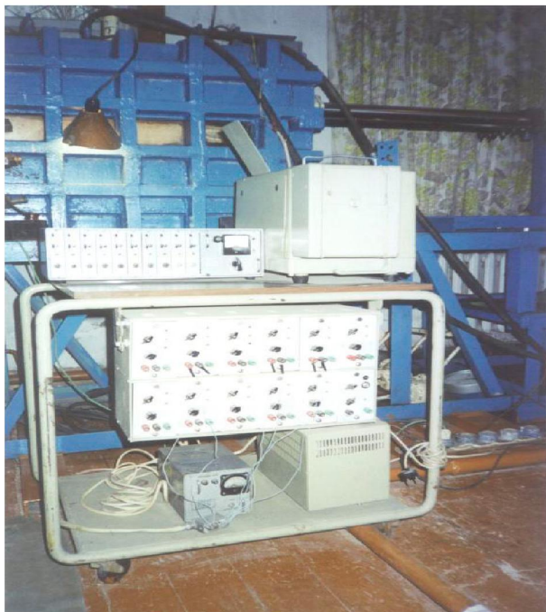
Рис. 3. Измерительно-записывающая аппаратура

получить стабильную прочность грунта в контейнере.