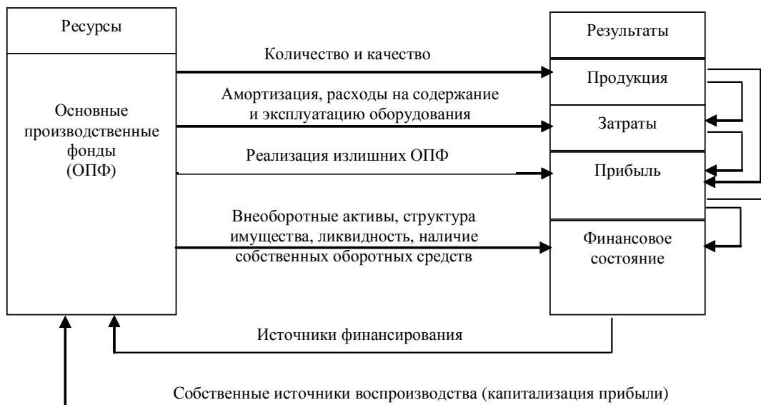
Рис. 1. Взаимосвязь основных фондов с результативными показателями производства [2, с. 95]

– сокращению ремонта активной части основных фондов путем специализации и концентрации ремонтного хозяйства;