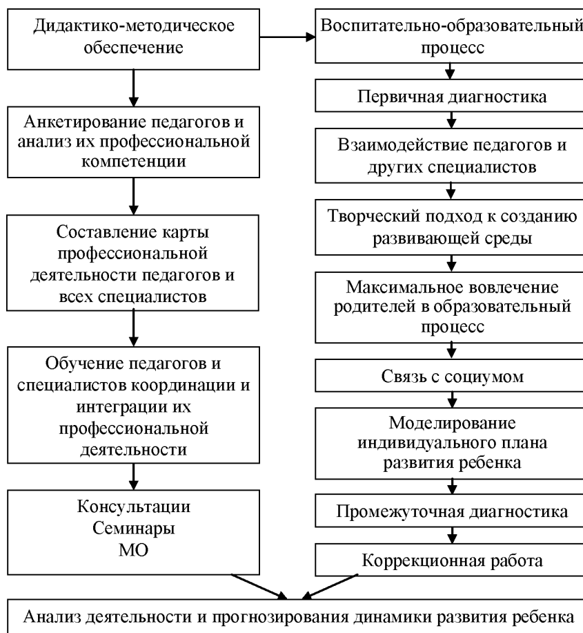
Рис. 3. Организационные основы свободного развития ребенка в Центре дополнительного образования для одаренных детей