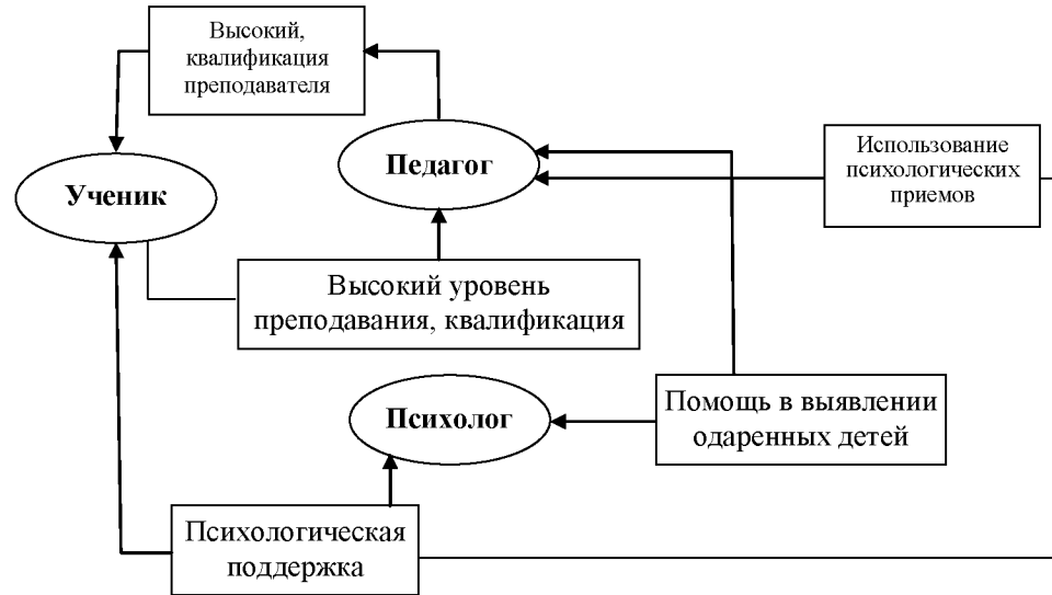
Рис. 2. Взаимосвязь притязаний в системе отношений «одаренный ребенок – педагог – психолог»