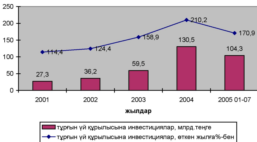
1-сурет. 2001–2005 жылдардағы тұрғын үй құрылысына салынған инвестициялар, млн теңге

Тұрғын үй құрылысын инвестициялауды жүзеге асырып жатқан, субъектілердің арасалмақтарын қарастыратын болсақ, жеке сектордың бұл саладағы