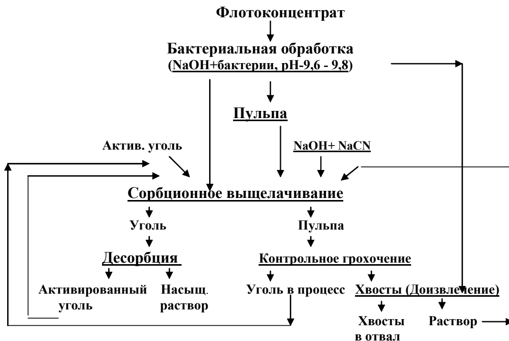
Рис. 3. Усовершенствованная технологическая схема сорбционного биохимического выщелачивания золота из флотационного концентрата

Установленный режим бактериального выщелачивания золота повышает извлечение на 20–30 %, снижает расход цианида на 50 %. В процессе выщелачивания флотоконцентрата с использованием гетеротрофных бактерий происходит детоксикация опасных для жизни человека и животных веществ, содержащихся в продуктах переработки упорных золотосодержащих концентратов.