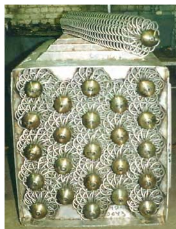
Рис. 2. Модуль регенератора

Данный регенератор имеет следующие преимущества: интенсивный теплообмен; высокий коэффициент регенерации; оптимальное гидравлическое сопротивление; высокая компактность при использовании труб небольшого типоразмера, объединенных в модули (рис. 2); самокомпенсация змеевиков при температурных расширениях; высокий коэффициент регенерации.