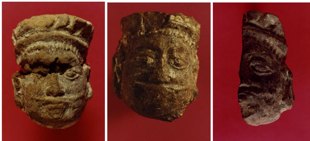
Рисунок 9 – Кулан. Голова «принца»

Датировка основывается на особенностях строительной техники: комбинированная кладка стен, размеры блоков и кирпича характерны для юго-западного Жетысу VII–VIII вв. В пользу такой датировки нижнего строительного горизонта говорит также комплекс керамики, где преобладает посуда ручной лепки – хумы, котлы, водоносные кувшины с широким горлом, а также столовые кувшинчики, покрытые красным ангобом и легким лощением.