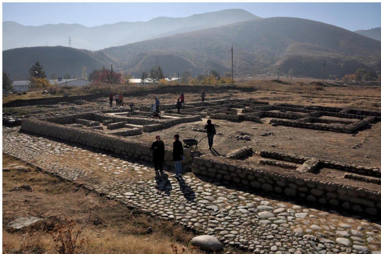
Рисунок 3 – Город Тальхир. Мостовая и участок застройки

Талгар, безусловно, соответствует Тальхиру, который упоминается в анонимном персидском географическом сочинении конца IX в. «Худуд ал-Алем» – «Границы мира». «Жители его воинственные, смелые и доблестные», – писал средневековый географ.