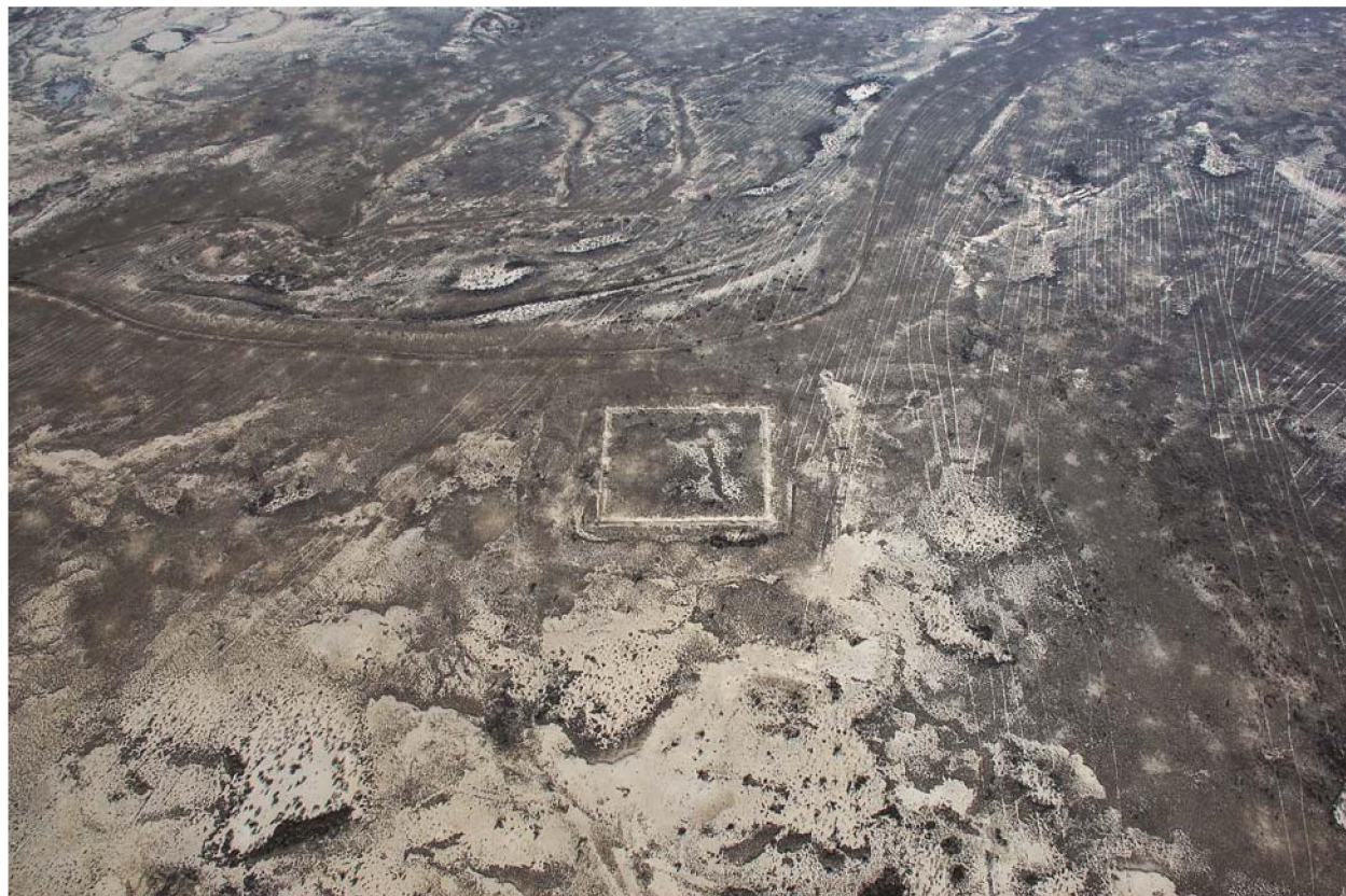
Рисунок 5 – Караван-сарай Карамерген. Аэрофото

Большая часть сосудов сделана на гончарном круге из плотного, хорошо промешанного теста, с примесью мелкого песка и мела. Керамические изделия обжигались в гончарных печах, и тесто при обжиге приобретало темно-красный либо темно-коричневый цвет.