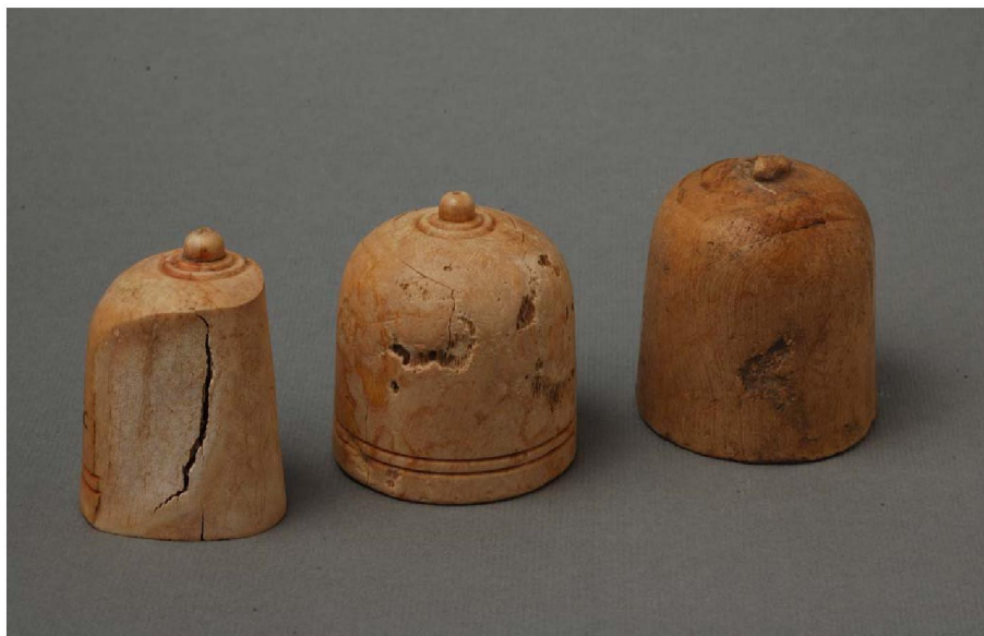
Рисунок 4 – Город Тальхир. Шахматные фигурки

Раскопки на городище ведутся с перерывом около 50 лет. Городище было включено в программу «Культурное наследие Казахстана». В результате раскопок изучена топография и застройка Талгара, его фортификация. Исследованы городские жилища в центральной части и за его пределами. Выявлена уличная сеть, городские благоустройства – водопровод, локальная канализация.