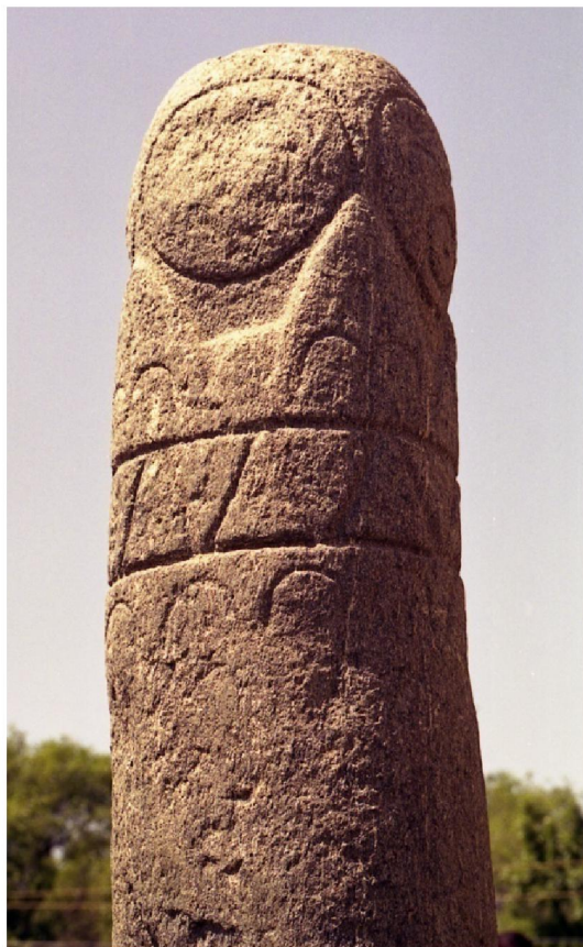
Рисунок 7 – Городище Орнек. Каменная колонна