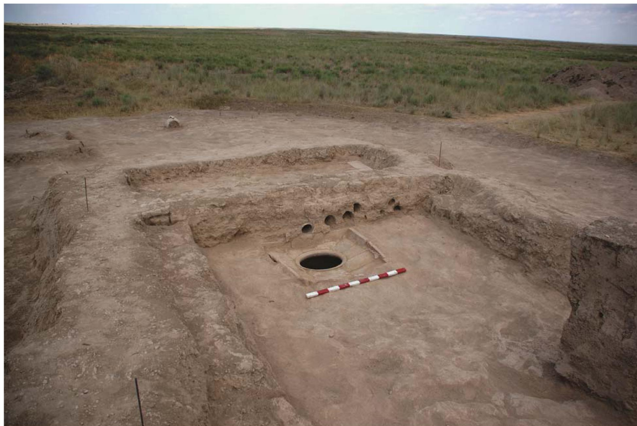
Рисунок 6 – Городище Актобе. Винодельня

стекла, изделия из металла и ювелирные изделия, сосуды из бронзы и большое количество монет [2, с. 308–313].