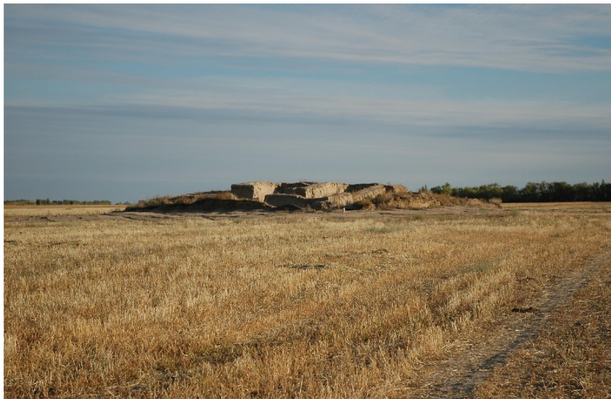
Рисунок 1 – Каялык. Буддийский храм