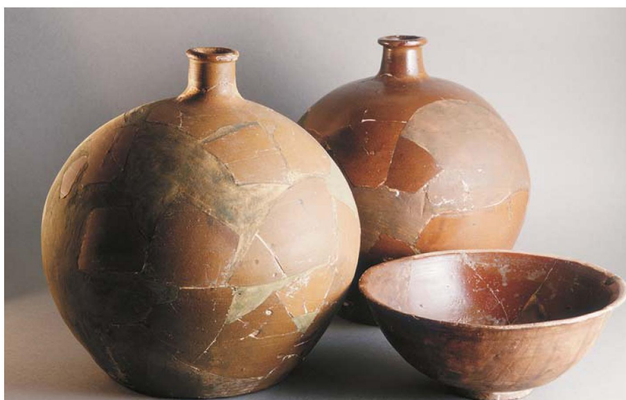
Рисунок 2 – Каялык. Китайская керамика

Внешние глинобитные стены представляют собой оплывшие валы шириной 11–13 м с сохранившейся высотой до 2–3,5 м. Они окружают четырехугольный в плане участок размером 1290 x 840 м. За стеной четко прослеживается ров шириной 10–17 м, глубиной 1–2 м. Въезды в городище были устроены в северо-западной, северо-восточной и юго-восточной стенах. Внутри вся обширная территория городища покрыта многочисленными буграми, впадинами – следами былой застройки. В центре огороженного четырехугольника выделяется центральная часть размерами 241 x 225 м, ориентированная углами по сторонам света.