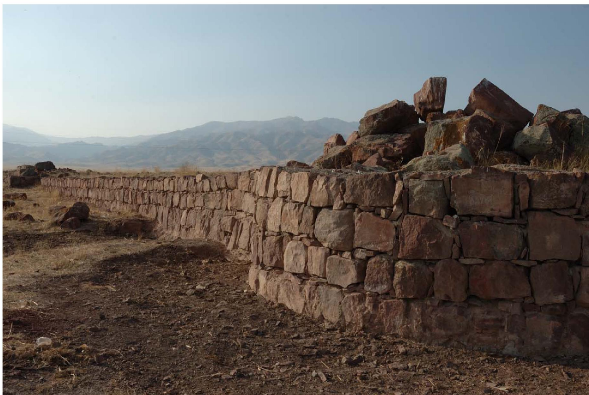
Рисунок 8 – Акыртас. Стена дворца