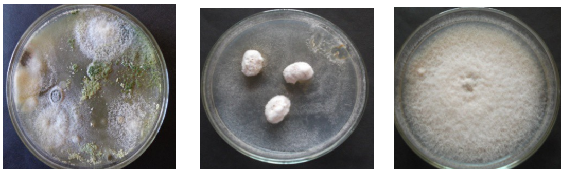
Рисунок 1 – Микрогрибное разнообразие, выявленное на семенах сои.

Из образцов СПХК «Будан» высевались однотипные колонии, напоминающие бактерии рода Pseudomonas , а также грибы предположительно трех видов Penicillium sp. , Alternaria sp. , Neurospora crassa .