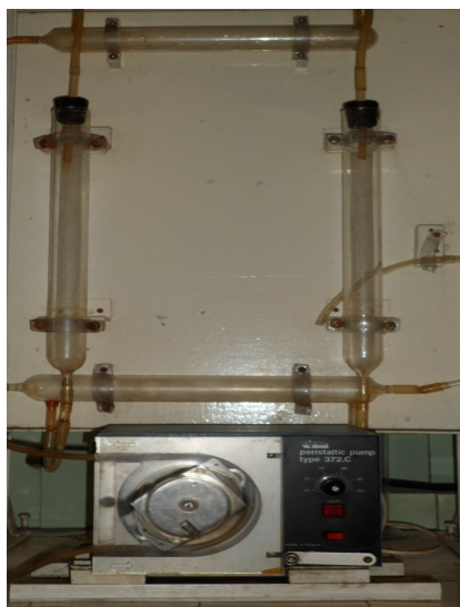
1-сурет – Стендтік құрылғы

Металл мен қорытпалардың коррозия үдерістерін сандық зерттеу тәсілі олардың агрессивті ортаның әсерінен өзгеріске ұшыраған механикалық, электрохимиялық қасиеттерінің сипаттамасын қамтиды. Металдар мен қорытпалардың коррозия жылдамдығының сандық көрсеткіштерін есептеп анықтауға болады.