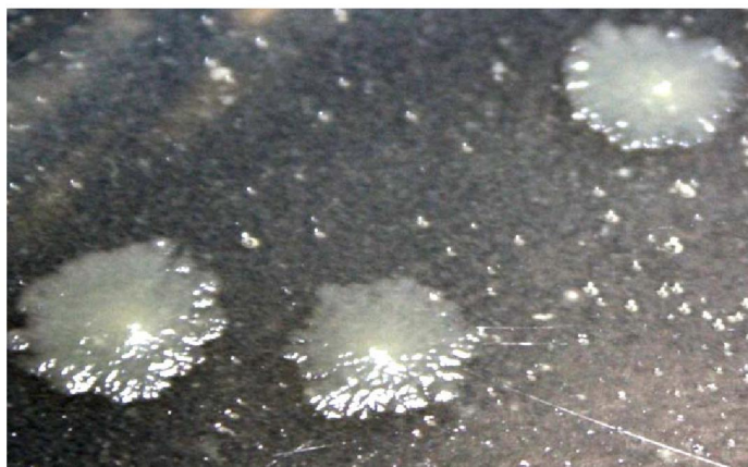
Рисунок 2. Колонии бактерий на питательной среде

Выделенные нами бактерии на картофельном агаре в чашках Петри образовывали мелкие колонии с волнистыми кораллообразными краями, матовые, блестящие, равномерно приподнятые. Они хорошо проявлялись через 2-3 суток роста (Рисунок 2).