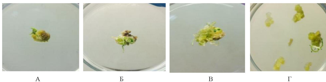
Рисунок 1 – образование первичных растений-регенерантов на селективных к КФ гриба рода Fusarium solani каллусных культурах картофеля: А, Б – первичные растения-регенеранты сорта «Аксор»; В, Г – первичные растения-регенеранты сорта «Невский»

Получение растений-регенерантов новых линий картофеля сортов «Аксор» и «Невский». Получение растений-регенерантов из селективных каллусных культур является достаточно трудоемким процессом, отличающимся низким выходом растений-регенерантов. Для повышения инициации растений-регенерантов из селективных морфогенных каллусов картофеля обоих сортов проводили предварительное культивирование в стрессовых условиях с низкими положительными температурами [3], после чего культивировали на оптимизированной питательной среде МС для каллусогенеза, содержащую витамины – 5,0 мг/л, 2,4 D – 5,0 мг/л, Fe-хелат – 5,0 мг/л и получали устойчивые каллусные линии. Каллусы культивировали в термостате при постоянной температуре 24 o C и 70%-ной влажности воздуха, без освещения. Пассажи проводили 1 раз через 10–12 суток. Затем каллусы помещали на среду для стимуляции регенерации с добавлением витаминов и гормонов: кинетин – 0,5 мг/л и 2,4 D – 0,5 мг/л и культивировали на свету. Через 5–6 недель культивирования селективных морфогенных каллусов получены первичные проростки растений-регенерантов обоих исследуемых сортов картофеля (рисунок 1).