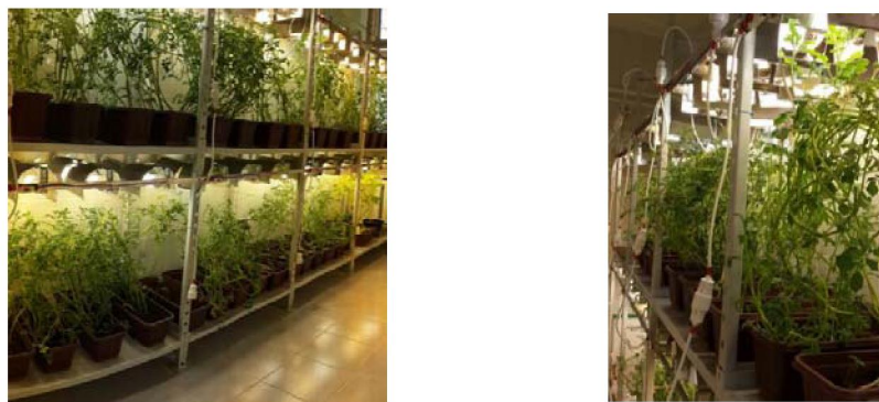
Рисунок 4 – Культивирование растений-регенерантов новых линий картофеля

Урожайность селективированных на устойчивость к фузариозу растений сорта «Невский» составила в среднем от 3 до 5 мини клубней на одно растение. Средний вес мини клубней составил 12–16 г. В пересчете на одно растение средний вес мини клубней составил 40–80 г (рисунок 5).