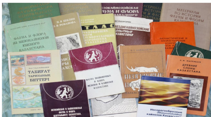
Рисунок 1 – Некоторые печатные продукции лаборатории

Сотрудники лаборатории за 70 лет опубликовали более сотни научных статей и приняли участие во множестве международных конференциях как Казахстана, так и за рубежом, выступая с докладами. Ими издано 12 томов сборника «Материалы по истории фауны и флоры Казахстана» и более 20 монографий (рисунок 1).