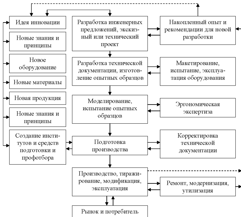
Рис. 1. Обобщенная схема жизненного цикла инноваций (Примечание – по данным работы [3, с. 51])

Рассмотрим данный вопрос более подробно на примере механизированных комплексов (крепей), широко применяемых на угольных шахтах и подходящих для разных горно-геологических